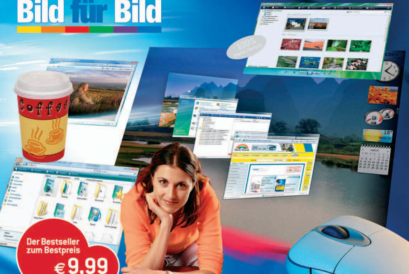
Bild für Bild